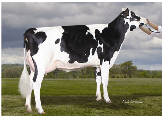
RICHMOND-FD S BARBARA GRANDDAM