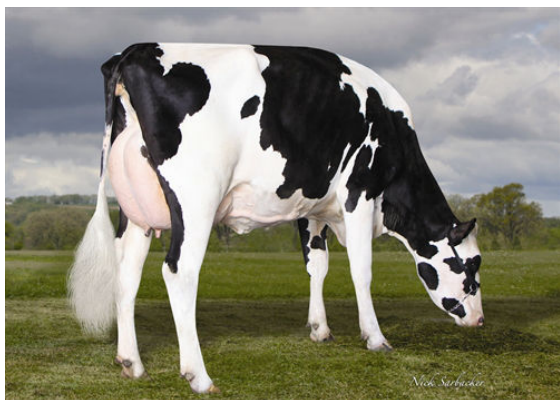
RICHMOND-FD S BARBARA GRANDDAM